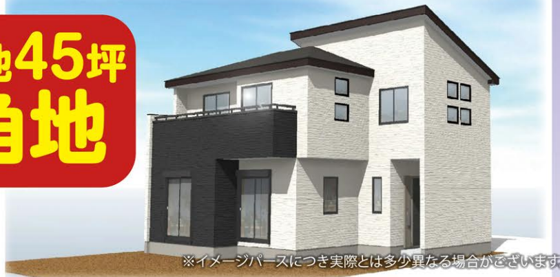
※イメージパースにつき実際とは多少異なる場合がございます。