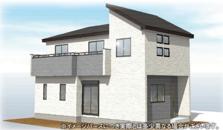
※イメージパースにつき実際とは多少異なる場合がございます。