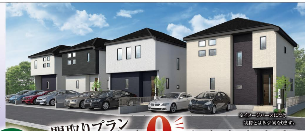
※イメージパースにつき 実際とは多少異なります。