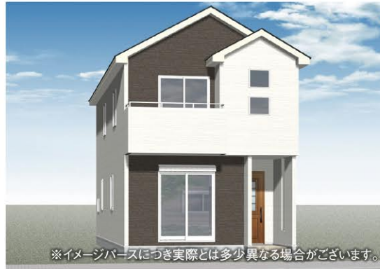
※イメージベースにつき実際とは多少異なる場合がございます。