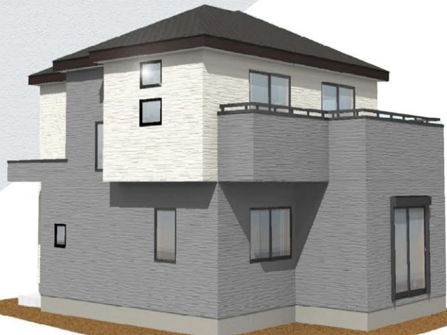
※イメージパースにつき実際とは多少異なる場合がございます。