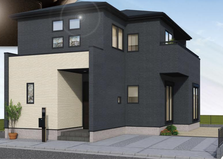
※イメージパースにつき実際とは多少異なる場合がございます。