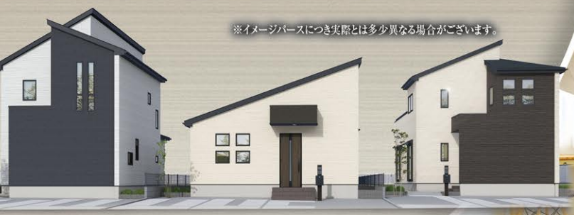
※イメージベースにつき実際とは多少異なる場合がございます。