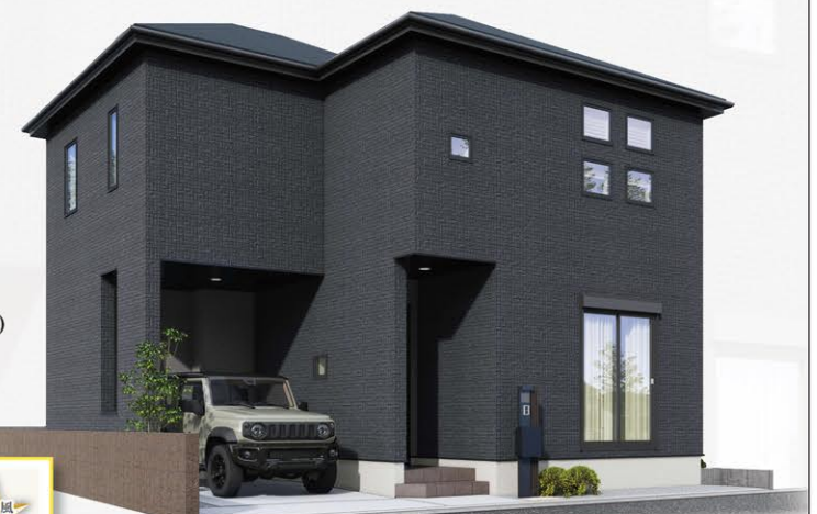
※イメージパースにつき実際とは多少異なる場合がございます。