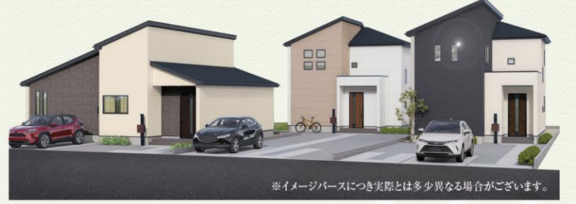
※イメージパースにつき実際とは多少異なる場合がございます。

所在地 / 小山市大字神鳥谷字本村680番1他 交通 / JR東北本線(宇都宮線)「小山」駅バス13分「竹の台市営住宅前」徒歩3分 土地権利 / 所有権 地目 / 山林 都市計画 / 市街化区域 用途地域 / 第二種住居地域 建ぺい率 / 60% 容積率 / 200% 防火指定 / 22条区域 其他法令上の制限 / 文化財保護法(埋蔵文化財)、宅地造成及び特定盛土等規制法、都市再生特別措置法 建物構造 / 木造2階建(1-2号棟)、平屋建(3号棟) 完成 / 2025年10月 接道 / 北東側4.0m公道 設備 / 公営水道、都市ガス、下水道、システムキッチン、温水洗浄便座、シャワー付洗面化粧台、ペアガラス、浴室乾燥機付ユニットバス、外構、カーポート 其他 / ※電波障害等によるケーブルTV、共聴アンテナの申込はお客様の負担となります。※電気供給の為、敷地内に電柱及び支線が入る場合があります。※所有権移転登記手続きにおいて当社指定の司法書士を利用して頂きます。※図面と現況に相違がある場合は現況を優先とします。※TVアンテナ、網戸、照明器具、カーテンレール、面格子は付きません。※網戸一式別途165,000円(税込)※表題登記別途93,500円(税込)※フラット35ご利用の場合における各証明書取得代金が別途必要になります。