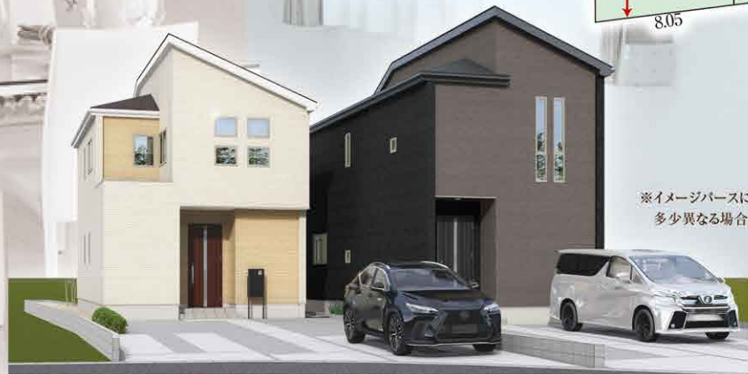
※イメージバースにつき実際とは多少異なる場合がございます。

所在地/高崎市岩鼻町字坂下甲355番1他 □交通/JR八高線「北藤岡」駅徒歩19分 □土地権利/所有権 □地目/宅地 □都市計画/市街化区域 □用途地域/第一種住居地域 □建ぺい率/60% □容積率/200% □建物構造/木造サイディング貼スレート葺2階建 □完成予定/令和8年7月上旬 □引渡予定/相談 □接道/北側5.5m~5.9m公道 □設備/公営水道、下水道、都市ガス、システムキッチン、温水洗浄便座、シャワー付洗面化粧台、ペアガラス、浴室乾燥機付ユニットバス、外構、カースペース □その他/電波障害等によるケーブルTV、共聴アンテナの申込はお客様の負担となります。※電気供給の為、敷地内に電柱及び支線が入る場合があります。※所有権移転登記手続きにおいて当社指定の司法書士・土地家屋調査士を利用して頂きます。※図面と現況に相違がある場合は現況を優先とします。※TVアンテナ、網戸、照明器具、カーテンレール、面格子は付きません。※網戸一式別途165,000円(税込) ※表題登記別途93,500円(税込) ※フラット35ご利用の場合における各証明書取得代金が別途必要になります。