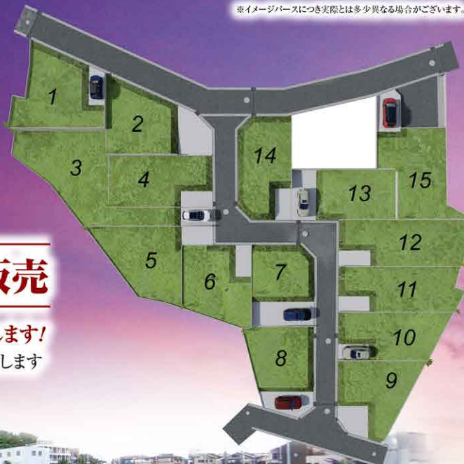
※イメージパースにつき実際とは多少異なる場合がございます。

次世代につなげる GRAFARE DESIGN ZEH 水準仕様 最高等級取得 主要6項目 長期優良住宅 減税 控除