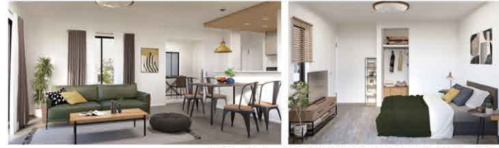
※イメージベースにつき実際とは多少異なる場合がございます。