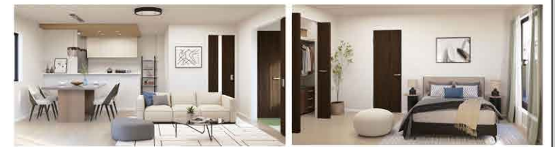
※イメージベースにつき実際とは多少異なる場合がございます。